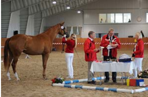
905 GJETERUDS ZERANDA