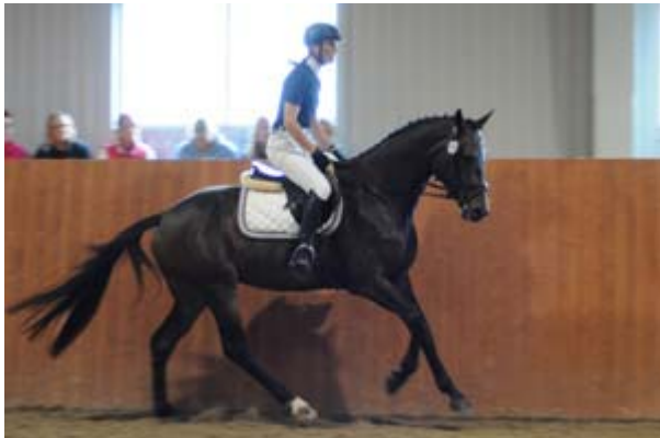
925 ENGERUPGAARDS DITRISHA