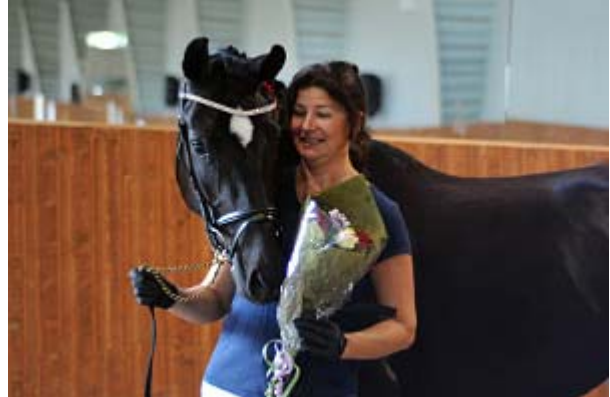
917 PETITE SOLEIL