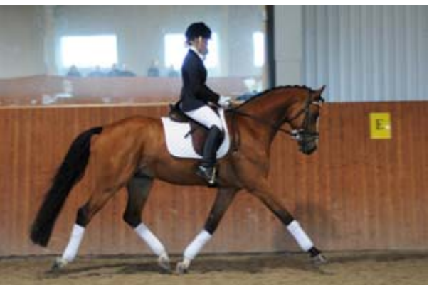
941 SANDBÆKS RIO-EL